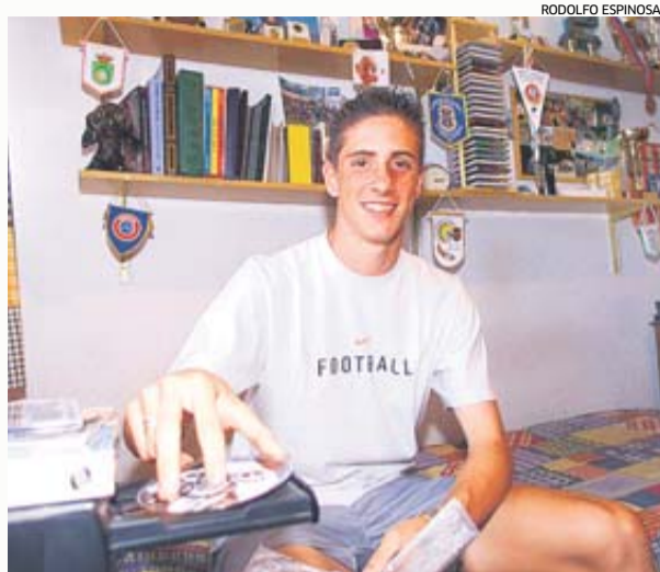
EL NIÑO MAS NIÑO Fernando Torres recibió a MARCA cuando era un adolescente al que señalaban como estrella del futuro.