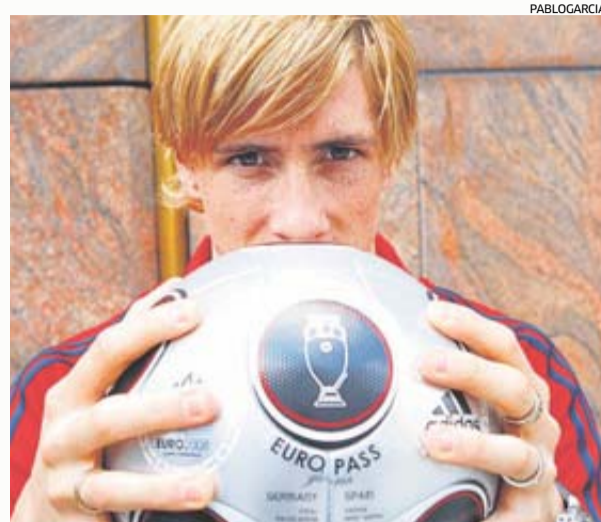
HORAS ANTES DE LA FINAL Este reportaje se hizo en Viena el día antes de que España jugara y ganara la Eurocopa de 2008.