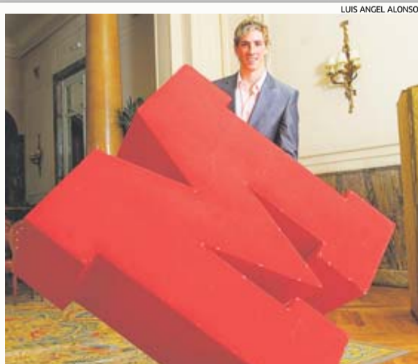
CON LA 'M' Reportaje en el hotel Ritz de Madrid con la 'M' de MARCA. Torres ya era una estrella de impacto mundial.

El niño ya tiene el poso del delantero experto que conoce todos los caminos para llegar al gol. Domina todas las facetas que debe tener la referencia ofensiva de un equipo que aspira a lo máximo: velocidad, desmarque, juego con balón y sin balón. No se encontrará incómodo en la competencia por el puesto y le puede beneficiar no llegar al final de temporada excesivamente cargado.