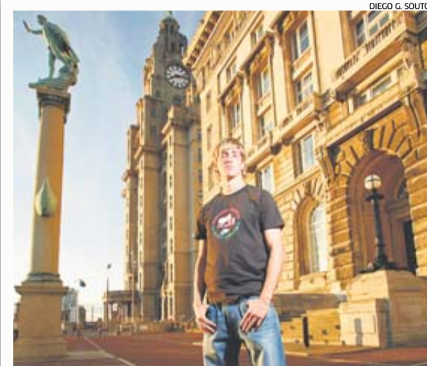
'THE KID' Fernando se marchó al Liverpool en el verano de 2007 y se convirtió en un ídolo en Anfield.