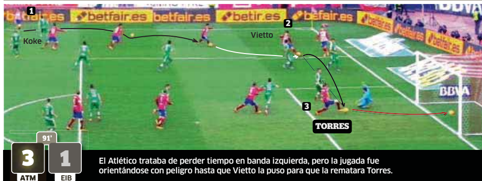
El Atlético trataba de perder tiempo en banda izquierda, pero la jugada fue orientándose con peligro hasta que Vietto la puso para que la rematara Torres.