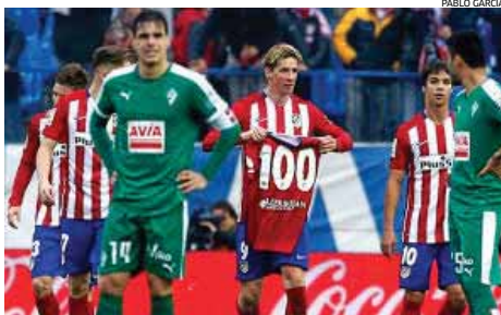
El Niño muestra la elástica conmemorativa del gol 100.