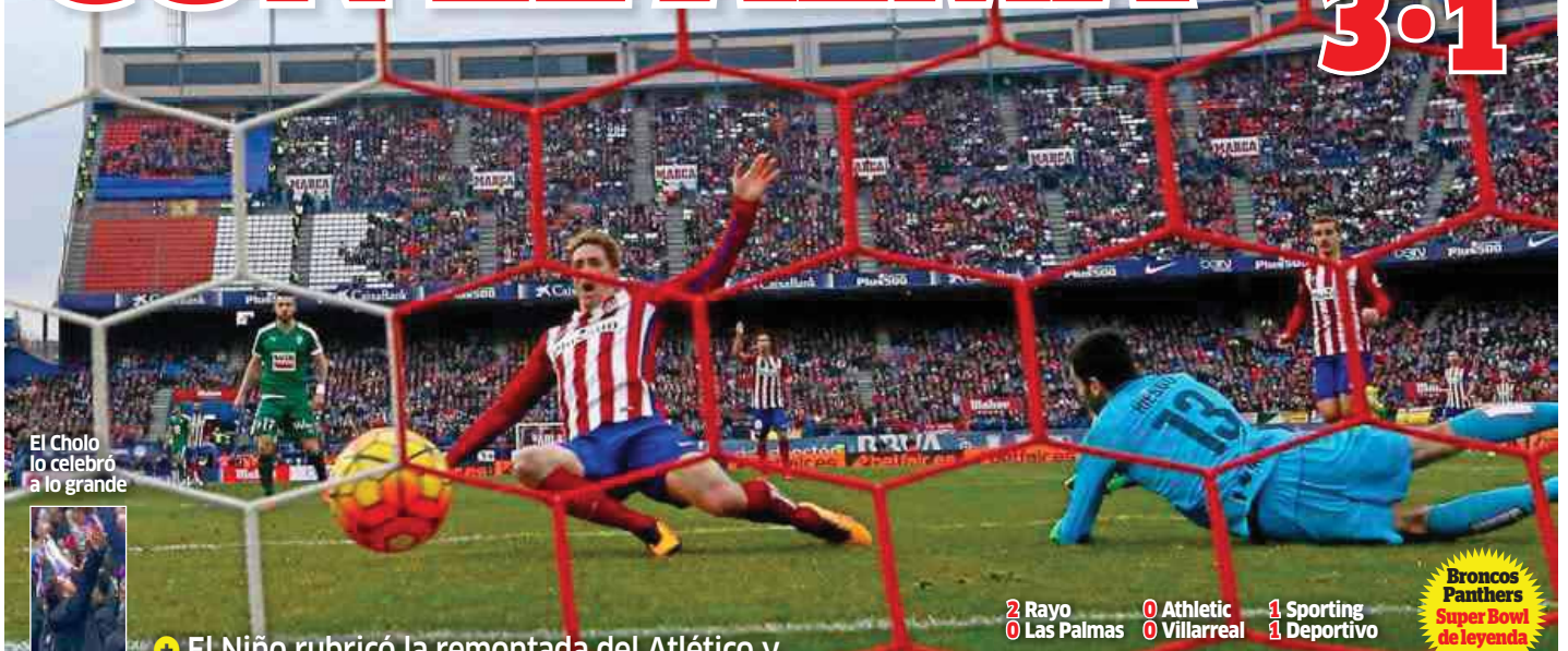
El Cholo lo celebró a lo grande