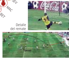
Goles al OFK Belgrado en los dos partidos de Intertoto.

BETIS 1-2 ATLÉTICO El gol que marcó en Sevilla al Betis en 2003 (1-1), es considerado por el propio Torres como su mejor tanto en su etapa rojiblanca.