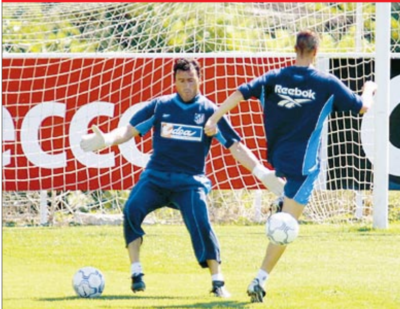
FIGURA EN EL ENTRENAMIENTO

Sería recomendable que se olviden para siempre etapas nefastas como las de Venturín o Pilipauskas vestidos como atléticos. La afición de este club se merece un respeto. Ahora entre un ascenso cercano y Fernando Torres parece que les ha tocado la lotería. Se lo merecían. El Atlético y su cantera anuncia tiempos de grandeza para un Vicente Calderón necesitado.