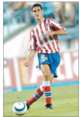
Inglaterra está loca por Pablo.