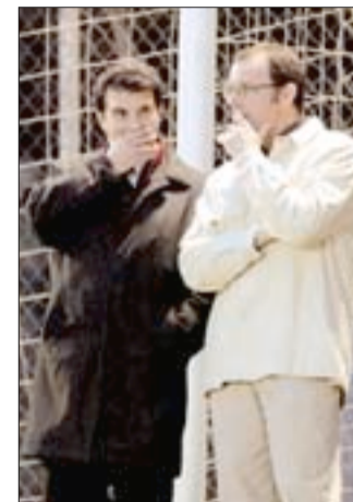
Laporta junto a Rosell.

evoluciones del delantero, pero al final se ha encontrado siempre con el problema de que el Atlético ni siquiera les ha querido escuchar, ya que no se olvidan de que el Niño se ha convertido en la referencia que tienen tanto la entidad como la afición para el futuro.