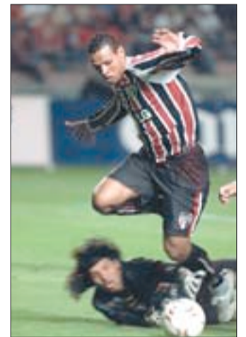
No olvidan a Luis Fabiano.