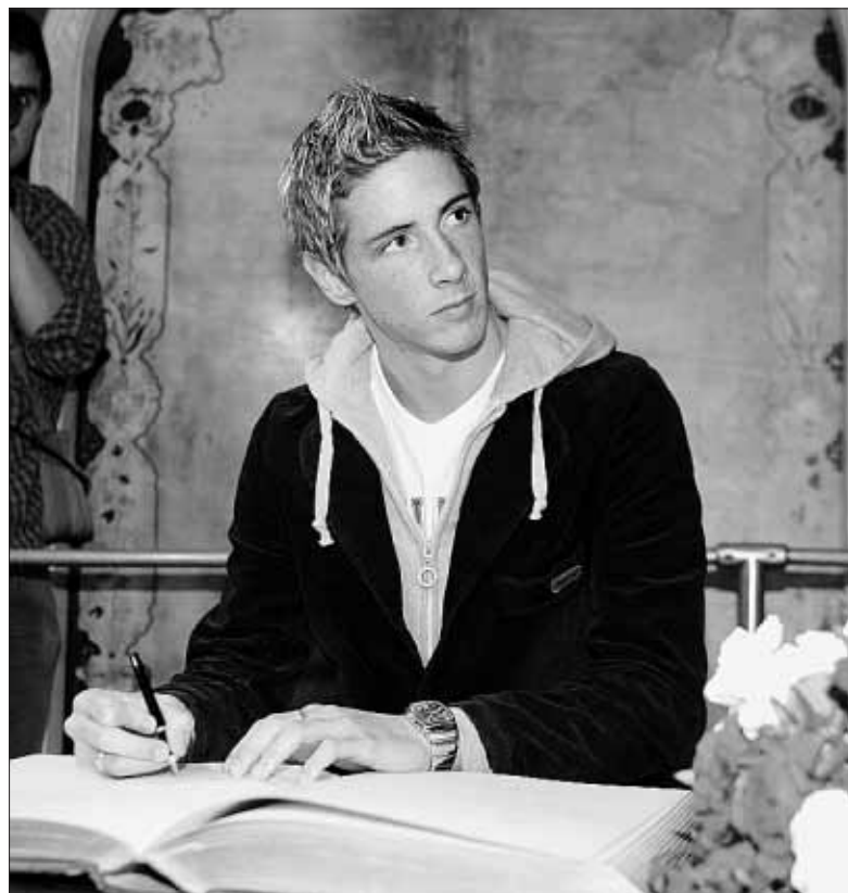
El delantero rojiblanco firmó en el libro de honor del Museo de Cera

En cuanto al cabello, que es natural de color castaño con mechas, se le implantaron 125 gramos. Por último, los ojos son color miel, fabricados por una empresa británica llamada 'J.H. Shakespeare', en Essex ●