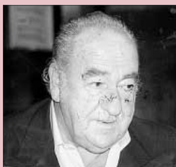
Calderón, inventó el término 'Pupas'

Vicente Calderón, en unas declaraciones realizadas tras perder la Copa de Europa ante el Bayern, tildó al equipo rojiblanco de 'Pupas'. Un sambenito que el Atlético de Madrid ha seguido aguantando con el transcurrir de los años. El calificativo en cuestión, visto lo visto en el estadio que lleva el nombre del 'inventor' de tal calificativo, no es grato para la afición colchonera. Una