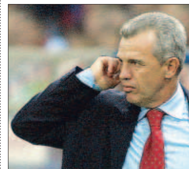
Aguirre da peso a Torres en la caseta