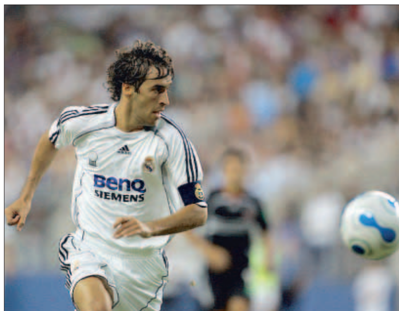
Raúl coloca al Atlético entre los favoritos para estar en lo alto de la tabla

sitio. Soy joven y me queda tiempo para conseguir los objetivos aquí”, avisa, antes de comentar cómo ha vivido su entorno estos complicados meses en los que se especuló con su futuro: “Mi familia siempre ha estado tranquila. Hablo poco con ellos de eso, a no ser que sea verdad. Me pueden aconsejar mucho, pero decido yo”. Y él decide en rojiblanco ●