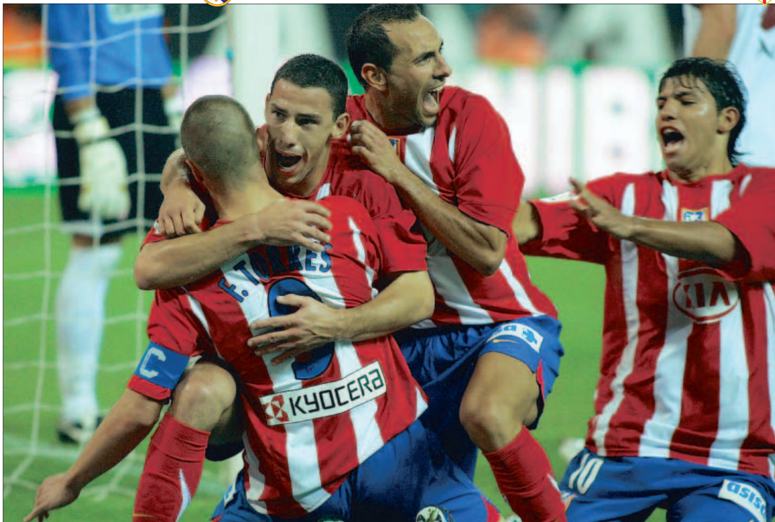
'La unión hace la fuerza'. Un dicho al que se agarra Fernando Torres para demostrar que el compromiso de la plantilla puede devolver al equipo al lugar que le corresponde