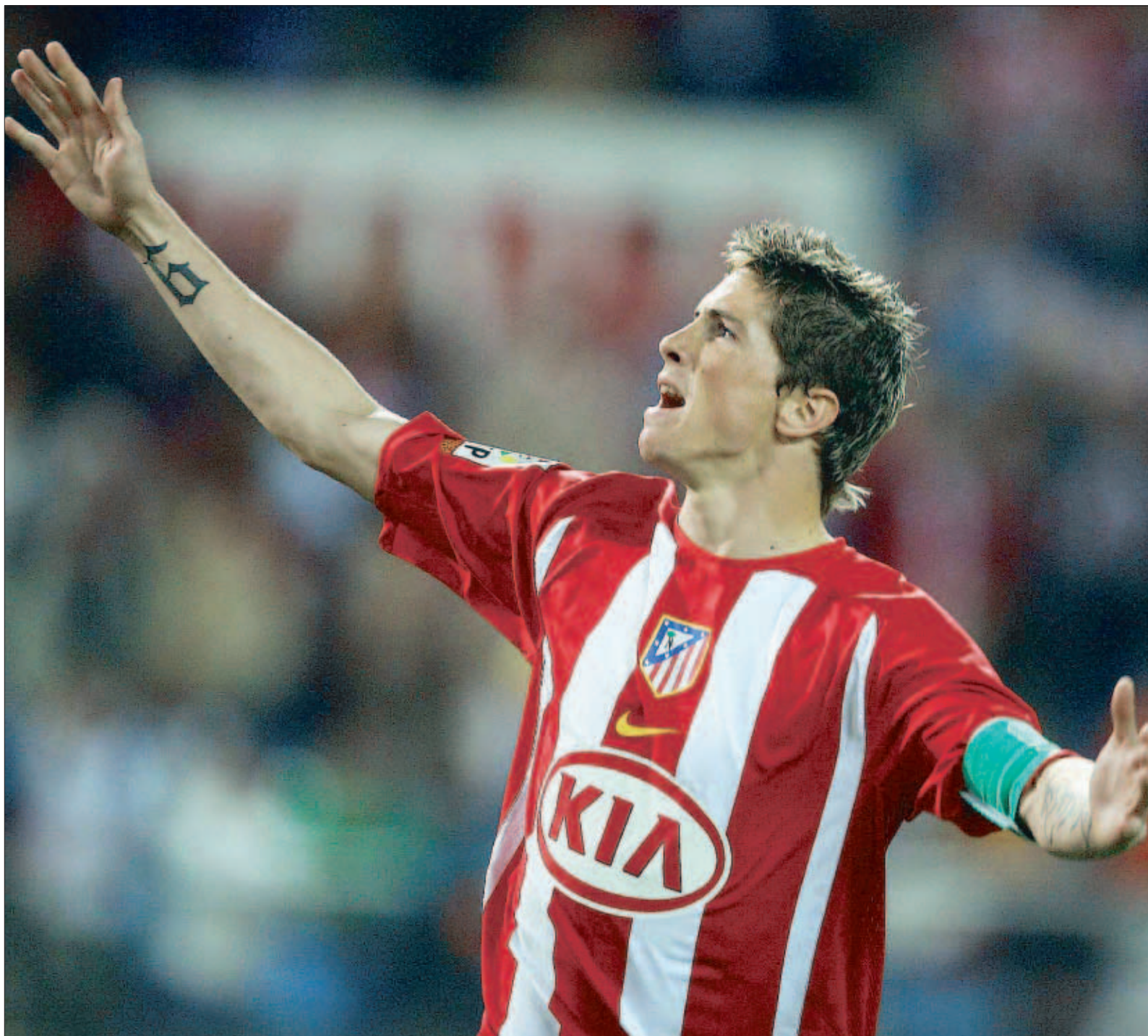
Fernando Torres va renovar su contrato en breves con el Atlético de Madrid, una relación que se prolongará hasta 2009 aunque su nueva cláusula será de tan solo 40 'kilos'

➔ La ampliación de contrato, al caer, conlleva mejora en la ficha y bajón considerable en la cláusula de 90 'kilos'