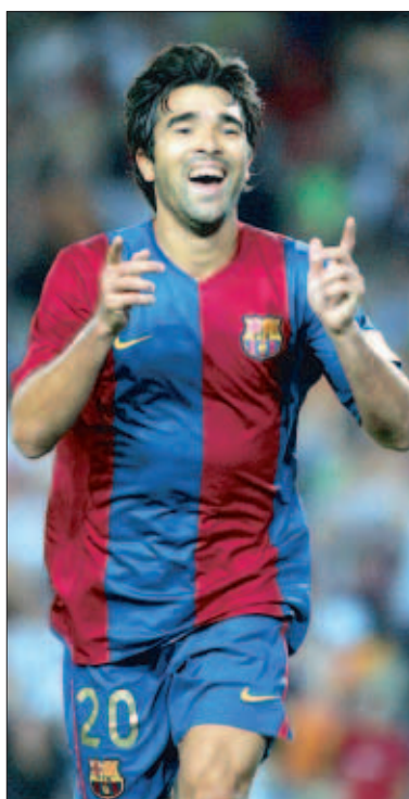
Deco, un favorito de Ronaldinho