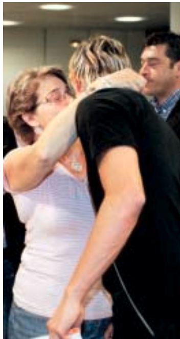
El 'Niño', despidiéndose de su madre