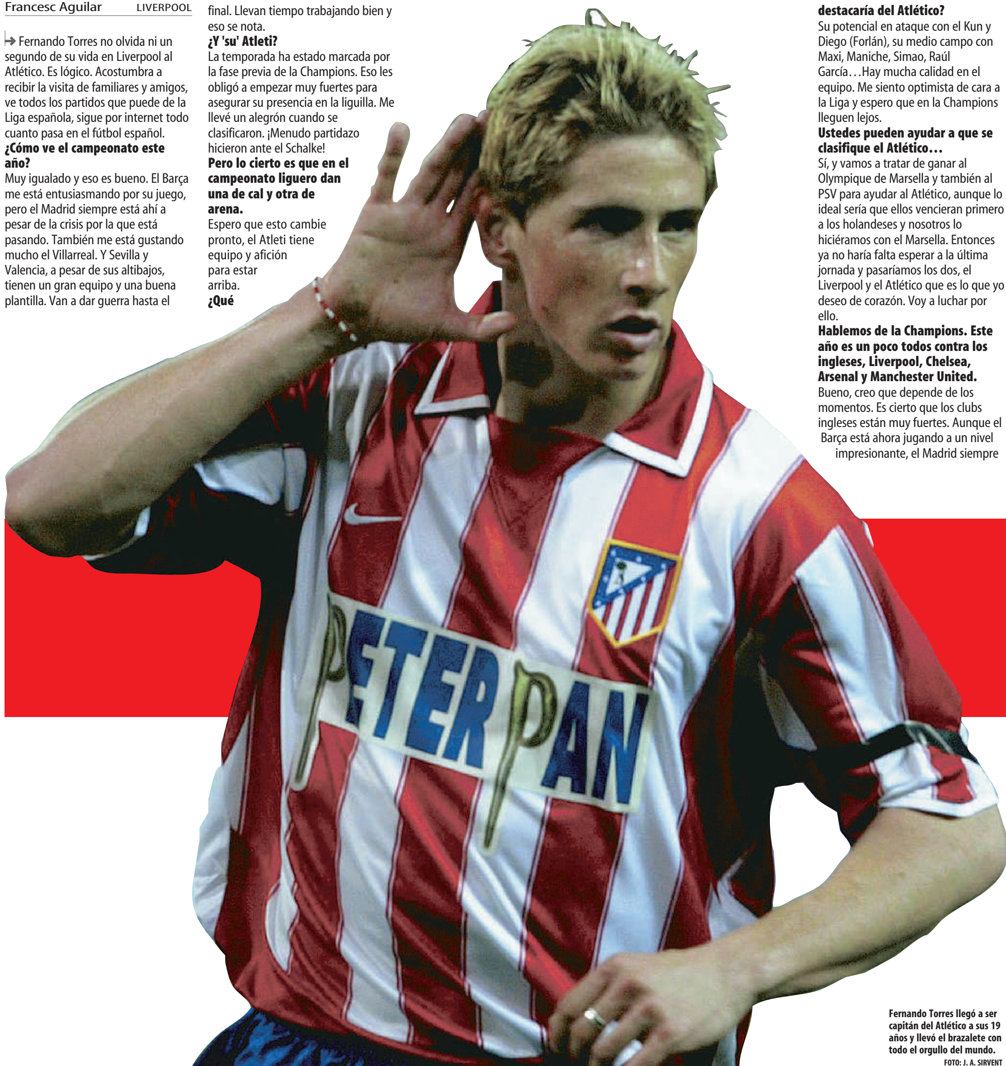
Fernando Torres llegó a ser capitán del Atlético a sus 19 años y llevó el brazalete con todo el orgullo del mundo.

Bueno, creo que depende de los momentos. Es cierto que los clubs ingleses están muy fuertes. Aunque el Barça está ahora jugando a un nivel impresionante, el Madrid siempre