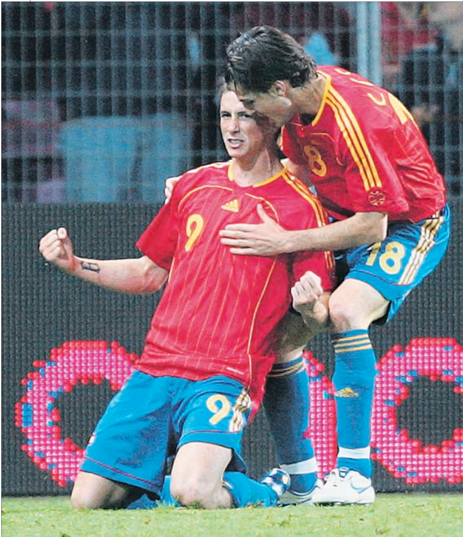
EL NIÑO DIABÓLICO. Torres marcó el gol de la victoria en jugada personal minutos después de fallar un penalti.

ante Rusia, pero llega (dos goles, un tiro al palo, un penalti fallado y un par o tres de buenas ocasiones) y más cuando Iniesta está en el campo.