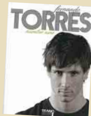
gráfico personal: ‘Campeón del mundo’, ‘Carrera contra el crono’, ‘¿Por qué soy del Atleti?’, ‘Anfield en el recuerdo’, ‘El Chelsea levantó el telón’, ‘Viena trazó el camino’ o ‘El podio de Zurich’ son algunos de sus 27 capítulos. La edición inglesa, actualizada ahora, se convirtió en el segundo libro de no ficción más vendido del país.