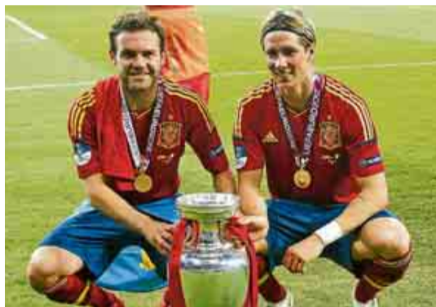
Mata y Torres posan con la Eurocopa de 2012.