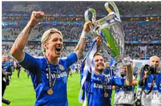
Los dos jugadores del Chelsea, con la Champions del pasado año.