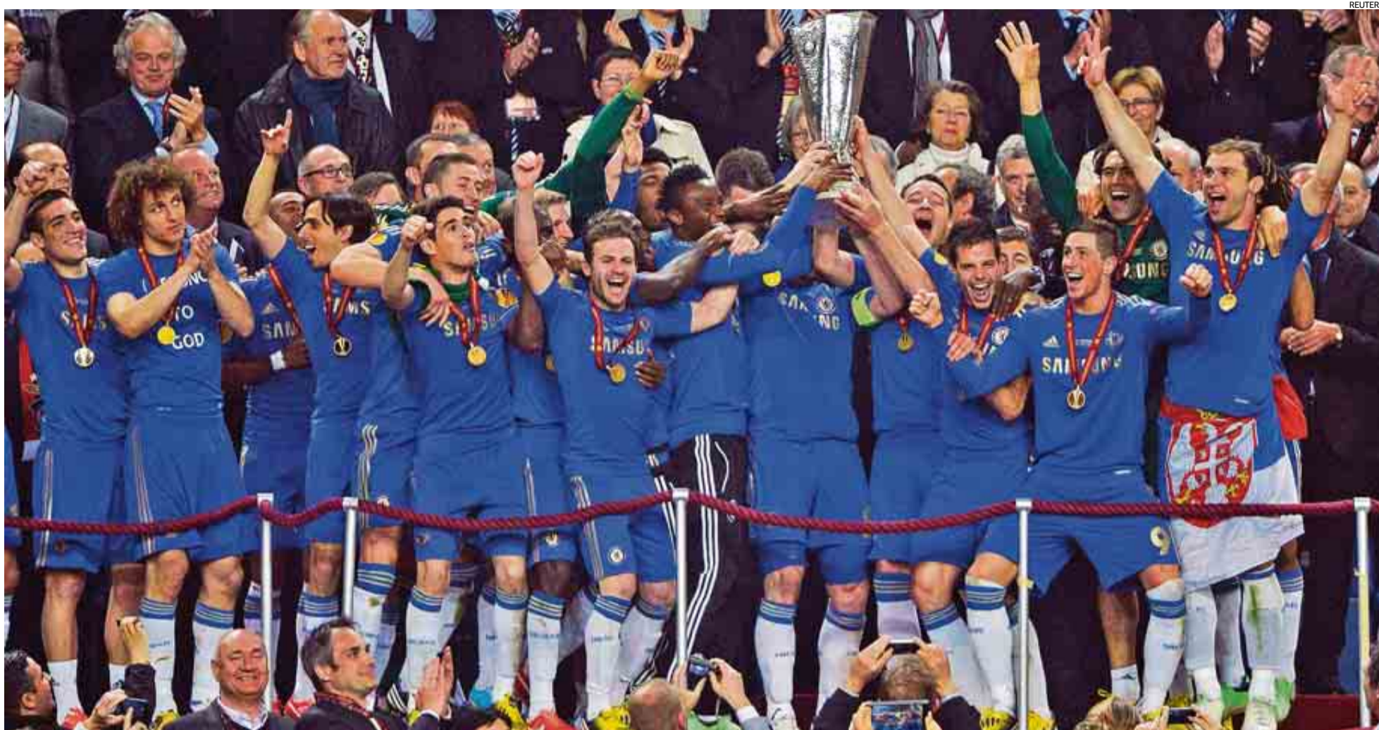
Terry (32) y Lampard (34), al que no se le ve el rostro en la imagen, alzan la Copa junto al resto del equipo ayer en Ámsterdam.