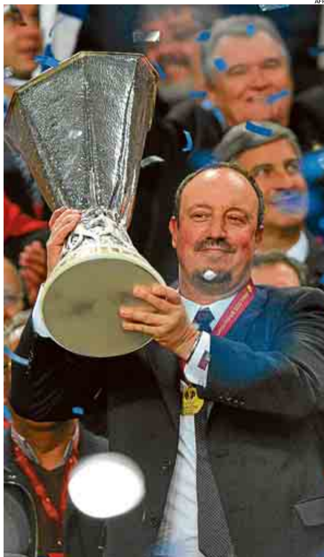
Rafael Benítez (53) levanta la Europa League.

“A los hinchas del Chelsea les diría sólo que disfruten”